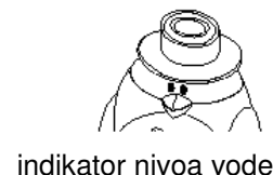
indikator nivoa vode